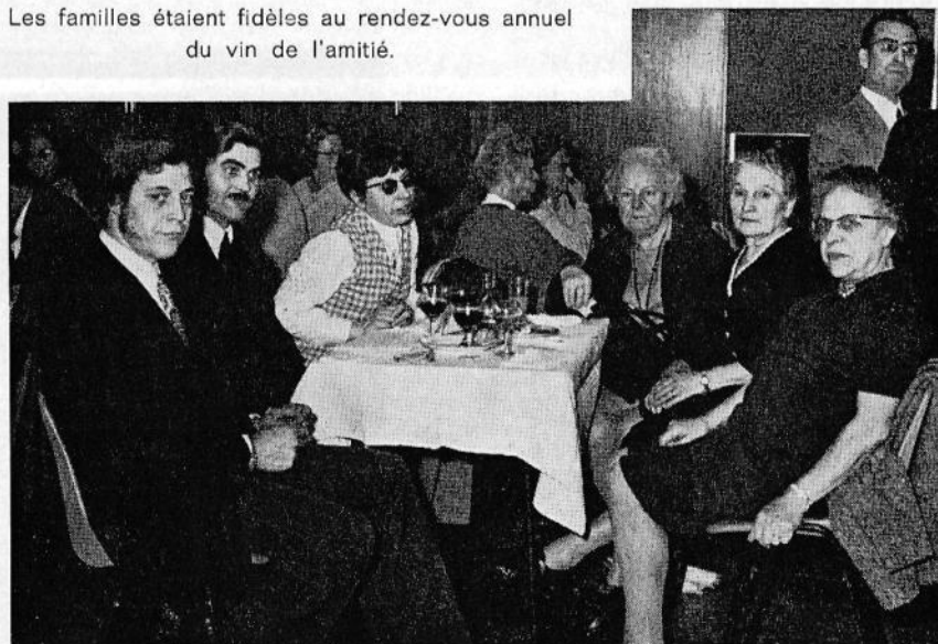
Les familles étaient fidèles au rendez-vous annuel du vin de l'amitié.