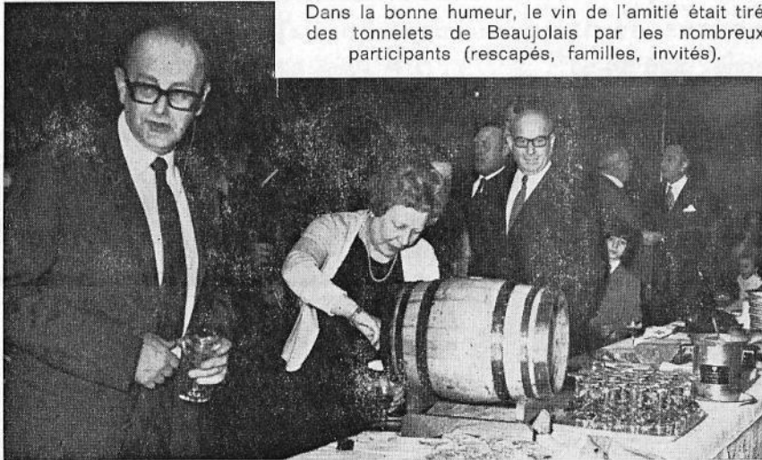
Dans la bonne humeur, le vin de l'amitié était tiré des tonnelets de Beaujolais par les nombreux participants (rescapés, familles, invités).

amis pour évoquer le sacrifice de nos camarades pour la libération et l'entente fraternelle de tous les peuples ; ne devient-elle pas sainte, elle aussi, la table qui nous rassemble fraternellement entre survivants autour de ceux qui nous ont quittés ? Ne tend-elle pas vers le même but qui est de rétablir la solidarité et l'amitié entre les hommes ?