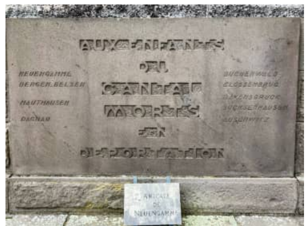
Sur le monument aux morts de Murat (Cantal)

PS : Enfin n'oublions pas la mise en route assez prometteuse de « Mauthausen en France » (voir ici p.30)