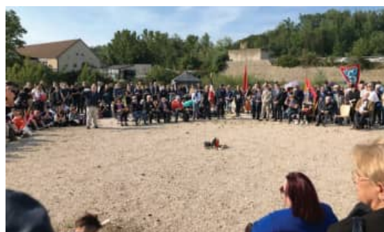
Gusen, 4 mai, une première cérémonie dans le vaste espace reconquis de la place d'appel