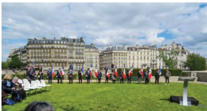
Sur l'Île de la Cité

La cérémonie parisienne s'est déroulée en plusieurs étapes : Mémorial de la Shoah, Mémorial de l'Île de la Cité, Arc-de-Triomphe.