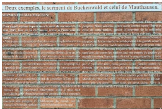
Mémoire des camps : sur les murs de la mairie annexe de Villeneuve-d'Ascq (Nord)

L'Amicale a été habilitée par l'Académie de Normandie pour intervenir dans les établissements scolaires et y porter des éléments de connaissance et d'interprétation du monde dans lequel cette réalité a pris corps. C'est un travail de mémoire et de vigilance citoyenne. Nous travaillons à ce que dans d'autres académies la même démarche, exigeante, soit entreprise : il s'agit d'abord, pour garantir la qualité de nos interventions, de former les intervenants en nombre suffisant. De même, pour les présentations de l'exposition ou la conduite des voyages et des visites qui les structurent, il y a toute une démarche de formation concertée que nous tentons d'amplifier.