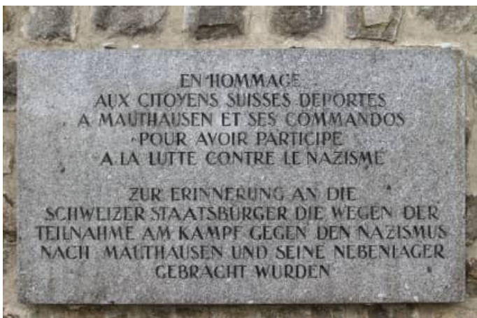
Une photo de cette plaque était déjà parue dans le bulletin n°204 (janv.81)