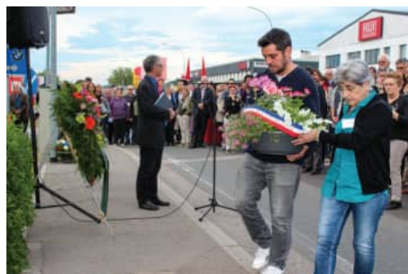
Steyr, 6 mai, stèle franco-espagnole