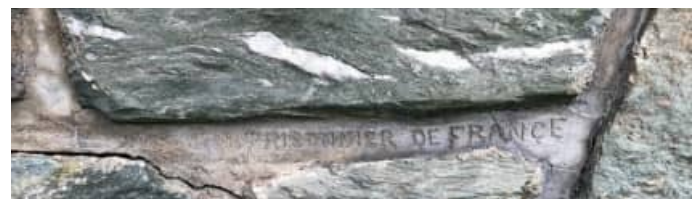
Inscription dans un joint d'un muret de la caserne