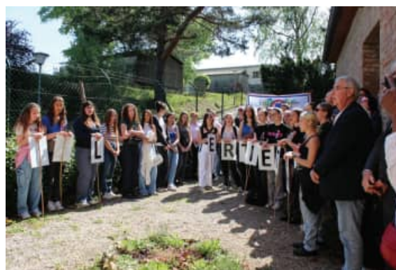
Melk, 6 mai, La Marseillaise par les élèves d'Altkirch