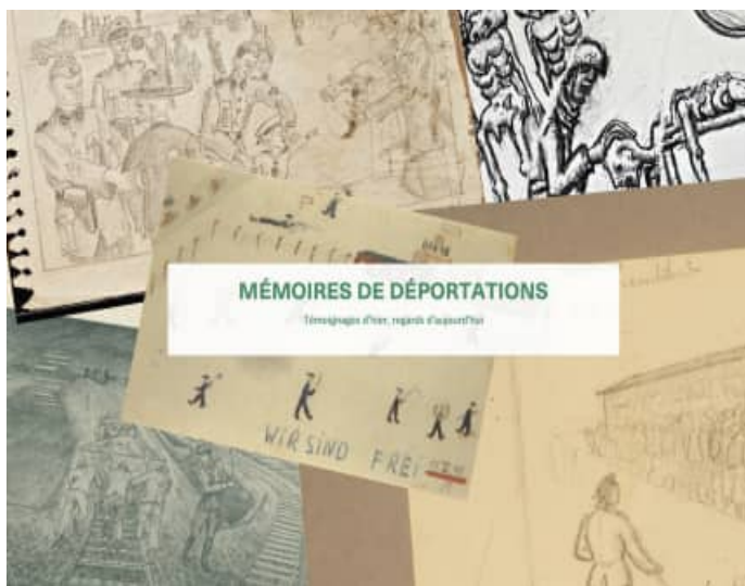
Capture d'écran de la page titre du diaporama en ligne sur le site de la ville de Paris