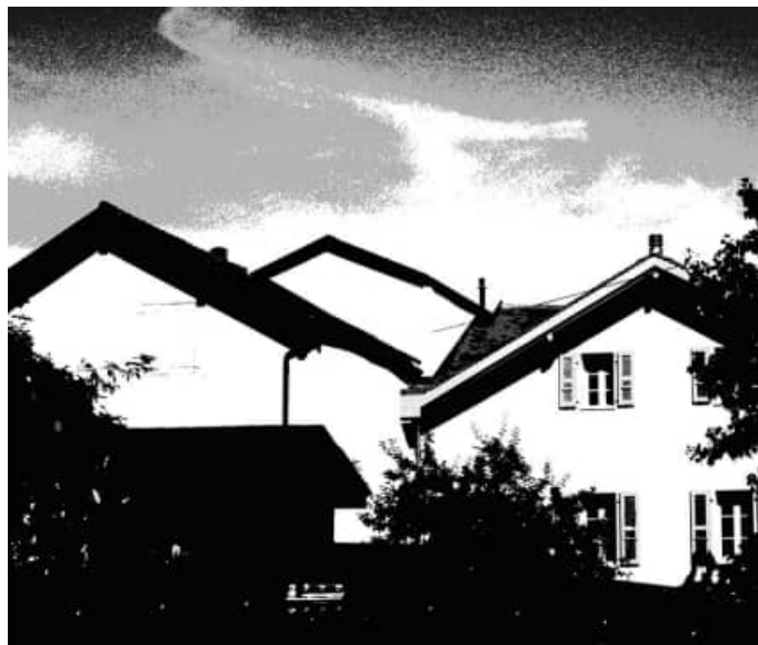
page de gauche

Zone pavillonnaire Proprettes les maisons Toboggan, balançoires jardinets palissés