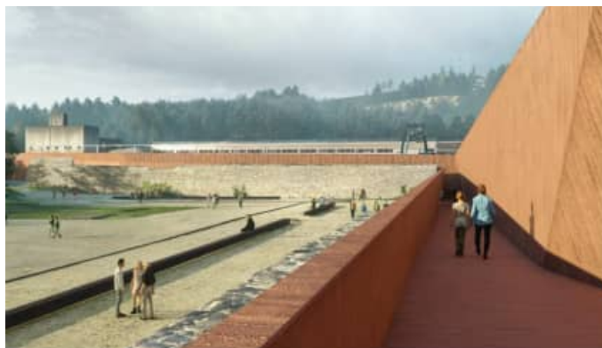
Projet de parcours vers le concasseur (Kieran Fraser Landscape Design)