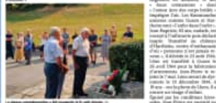
Le 15 août dernier, l'inauguration d'une plaque commémore les quatre passeurs de la vallée d'Aspe, morts en déportation.

Le 15 août dernier, l'inauguration d'une plaque commémore les quatre passeurs de la vallée d'Aspe, morts en déportation. Les photos en noir et blanc défilent le temps et l'espace. Sur le plateau de Lhers, l'inauguration d'une plaque redonne vie à quatre passeurs de la vallée d'Aspe, dont le chemin vers la liberté s'est achevé dans l'enfer des camps de concentration.