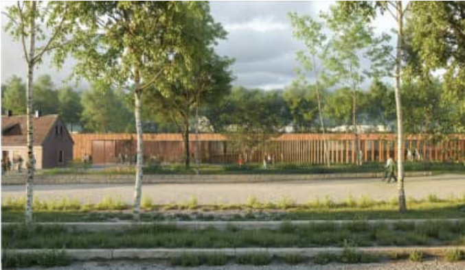
Projet du centre d'accueil des visiteurs près des baraques SS (cabinet Kieran Fraser Landscape Design)

Nous avons surtout échangé sur l'avancement des travaux d'aménagement du site de Gusen, qui normalement devraient être terminés pour l'automne 2027. L'architecte a été retenu, il s'agit de la société Kieran Fraser de Vienne.