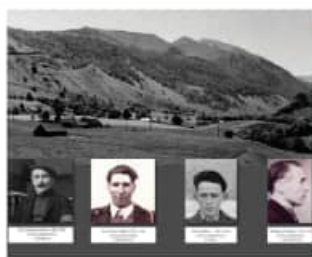
Le plateau de Lhers, point de passage stratégique vers l'Espagne durant la Seconde Guerre mondiale.